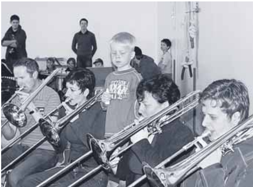
Muisig-Land: Eine klingende Geschichte, die alle Zuhörer in ihren Bann zog.